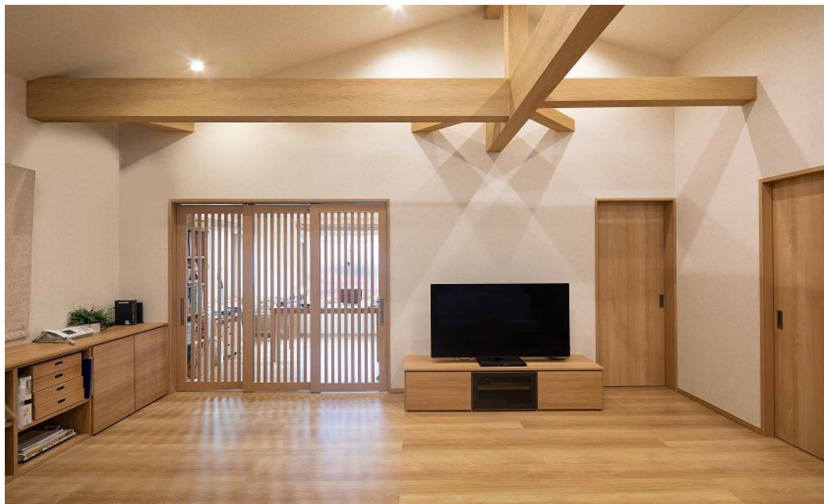
勾配天井やカラーリングの統一、引戸の採用で広さを感じる空間に

【間取り変更】思い入れのあるご自宅を、セカンドライフを見据え平屋へリフォーム。2階部分を減築しコンパクトに暮らせる間取りで充実感をより感じられる住まいが実現。