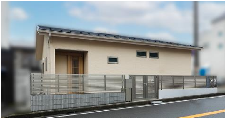
2階部分を減築し平屋に

【開放感と動線のこだわり】2階を減築したことで限られたスペースとなったリビングをすっきり広く明るく見せるため、屋根躯体を2×4構造とし、勾配天井に見える木部材を少なくする工夫をして開放的に。建具は心地よい広さを感じられるよう明るめの色で統一。リビングからはダイレクトに各室へアクセスできる動線を設計しました。